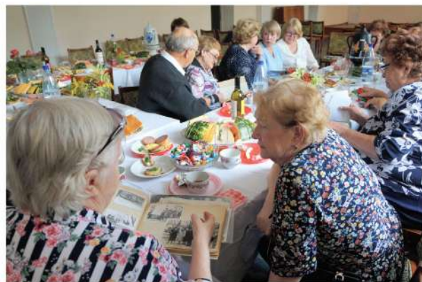
День пожилого человека