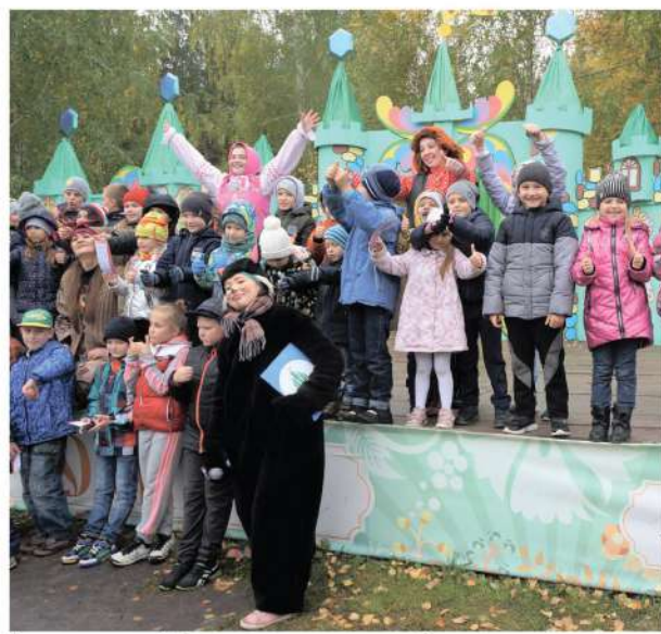
Праздник для детей «Посвящение в первоклассники. Слёт новичков»