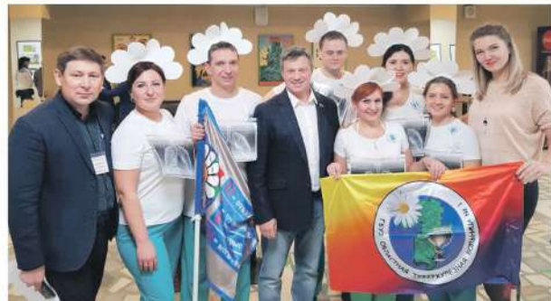
Конкурс «Рабочая песня-2019». Ансамбль «Поющие ромашки»